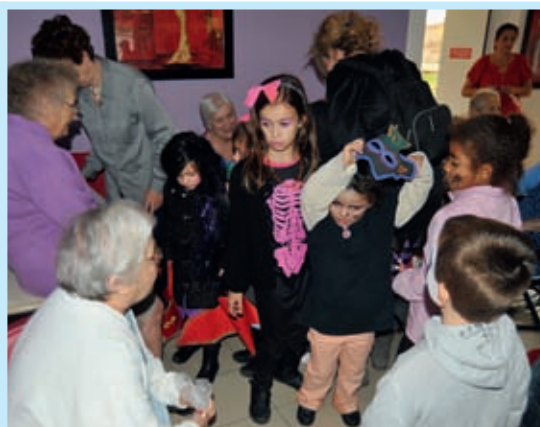
Le 27 octobre, rencontre entre les enfants du centre aéré et les résidents du foyer Les Iris