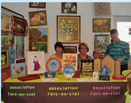
Fête des associations de Raphèle, place des Micocouliers et salle Gérard-Philippe